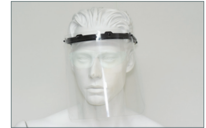
COMPATIBLE AVEC LE PORT DE LUNETTE