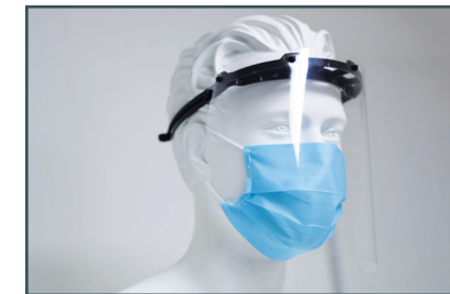
ADAPTÉ AU PORT D'UN MASQUE