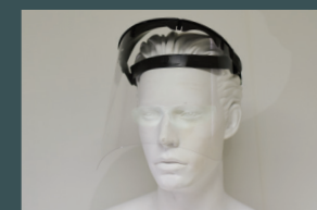
COMPATIBLE AVEC LE PORT DE LUNETTE