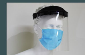
ADAPTÉ AU PORT D'UN MASQUE